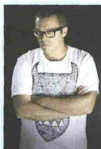
Frankie hi-nrg

(Sarah, la principessa e Rebecca, la sposa cercata - ed. Paoline) l'Atelier Gluck Arte organizza due giornate di laboratori di musica, scrittura e disegno per raccontare a bambini (7/11 anni) e adulti le eroine della Bibbia. Per i genitori c'è un incontro con una bibliista. In mostra 30 manifesti originali di film dedicati alla Bibbia. Sabato 24 e domenica 25 settembre, in via Gluck 45, ingresso libero su