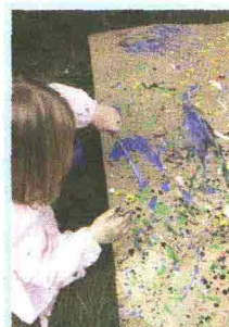
I lavori dei bambini