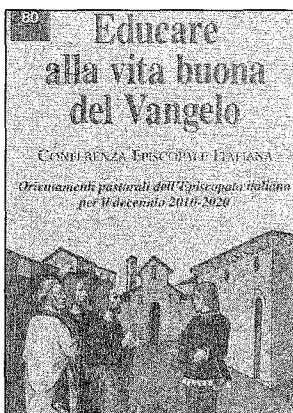
L'iniziativa è in assonanza con gli orientamenti dell'Episcopato italiano

La serie di incontri si inserisce perfettamente negli orientamenti pastorali dell'Episcopato italiano per il decennio 2010 – 2020 raccolti in un volume avente per titolo “Educare alla buona vita del Vangelo” (edizioni Paoline). I tempi sono comuni e visto che questi sono giorni in cui si celebra l'opera di don Giovanni Bosco viene spontaneo ricordare il suo motto sempre di grande attualità: «Essere buoni cristiani ed onesti cittadini». La forza per affrontare con determinazione tante difficoltà attuali nasce proprio da qui. giaco