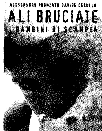
La copertina del libro "Ali bruciate"