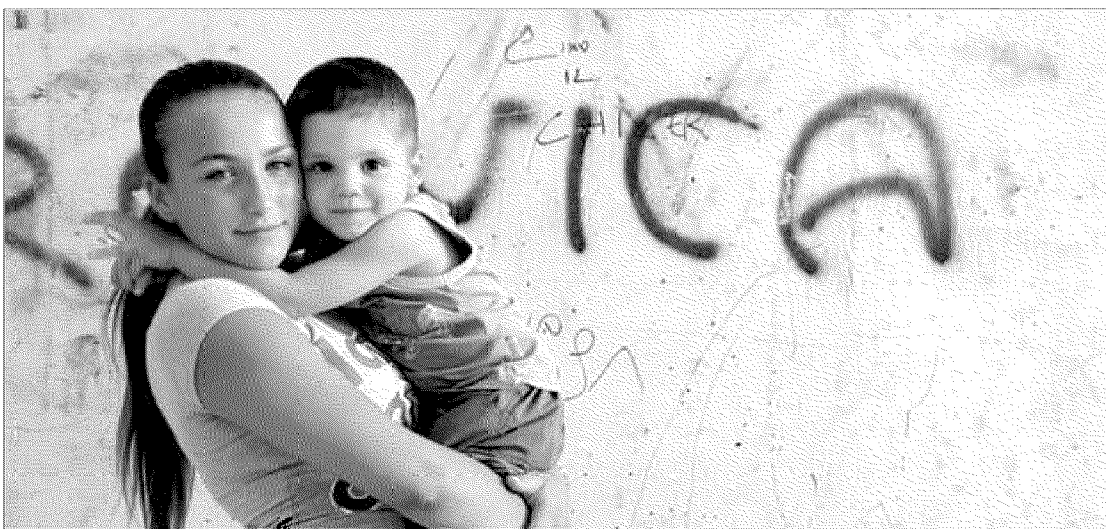
Un'altro scatto del volume

Cerullo lascia parlare le immagini: asciutte essenziali, esenti da quella tragicità patetica che spesso caratterizza i reportage