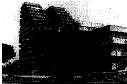
Le vele di Scampia

Dal dolore alla vita. I ragazzi rivendicano il diritto a una città normale, dichiarano guerra preventiva a Cosa Nostra e mostrano la collettiva responsabilità. Il