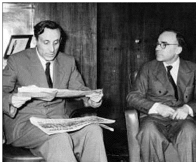
UNA FOTO storica: Giuseppe Dossetti con Giorgio La Pira