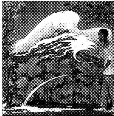
Roberto Piumini - illustrazioni di Cecco Mariniello, Aliou dell'acqua , Belvedere Marittimo (CS), Edizioni Coccole e caccole, pp. 32, euro 11,00

del deserto fino al Mediterraneo, una traversata del mare fino in Italia. Una storia come molte, intendo di quelle vere di migranti. Una storia, qui in senso narrativo (testuale e iconico), asciutta ma piena e quindi giusta per raccontare - senza esotismi, buonismi o altri sciocchi - ismi (pietismi compresi) - le vicende e i sogni, sovente semplici, di chi arriva nel nostro paese partendo da un altrove che difficilmente riusciamo ad immaginare davvero. E l'albo di Mariniello e Piumini può aiutare allora a rispondere anche alle domande da bar, tipo "ma cosa pensavamo di trovare qua?" (soggetto sottinteso: gli stranieri), in modo pacato. Il tema delle carrette del mare, variamente e spesso ambigualmente alla ribalta sui mezzi d'informazione, trova un suo deli-