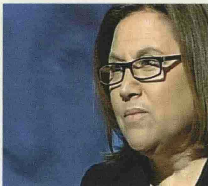
Lucia Annunziata "In 1/2 h" su Rai Tre

La tecnologia aiuta, cambiano gli strumenti, abbiamo le