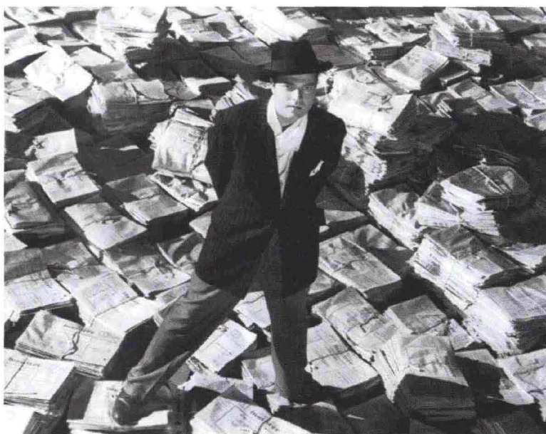
Scene di giornalismo al cinema: Quarto potere , di Orson Welles (1941)

ne? Semplificando, si potrebbe rispondere che l'editoria per ragazzi generalmente riflette un'immagine positiva del mondo dell'informazione e dimostra una simpatia verso il giornalista, visto come figura sociale di riferimento della collettività.