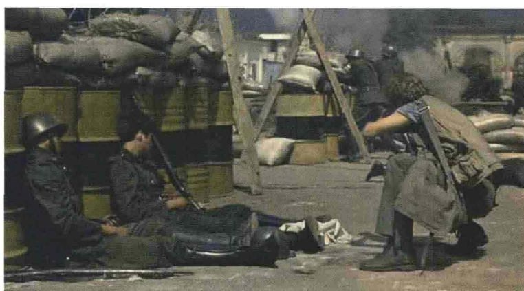
Salvador , di Oliver Stone (1986)

Allora come spiegherebbe a un giovane la professione?