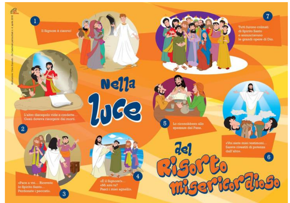
Immagine del poster che segna le tappe della via lucis, scaricabile da paoline.it: http://goo.gl/p3pL3U

Donare luce: Aiuto qualche persona scoraggiata e triste a risollevarsi dalla sua afflizione, con un sorriso, un bacio, una parola amabile..., e a ritrovare l'amore del Signore e la gioia della vita.