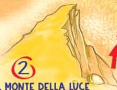
SUL MONTE DELLA LUCE Matteo 17,1-9