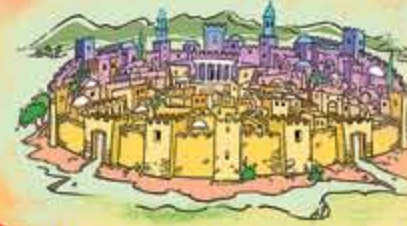
6 NELLA CITTÀ DELLA GIOIA Matteo 21,1-11