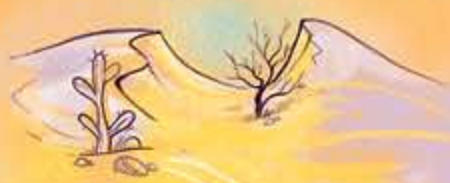
NEL DESERTO DELLA RICERCA Matteo 4,1-11