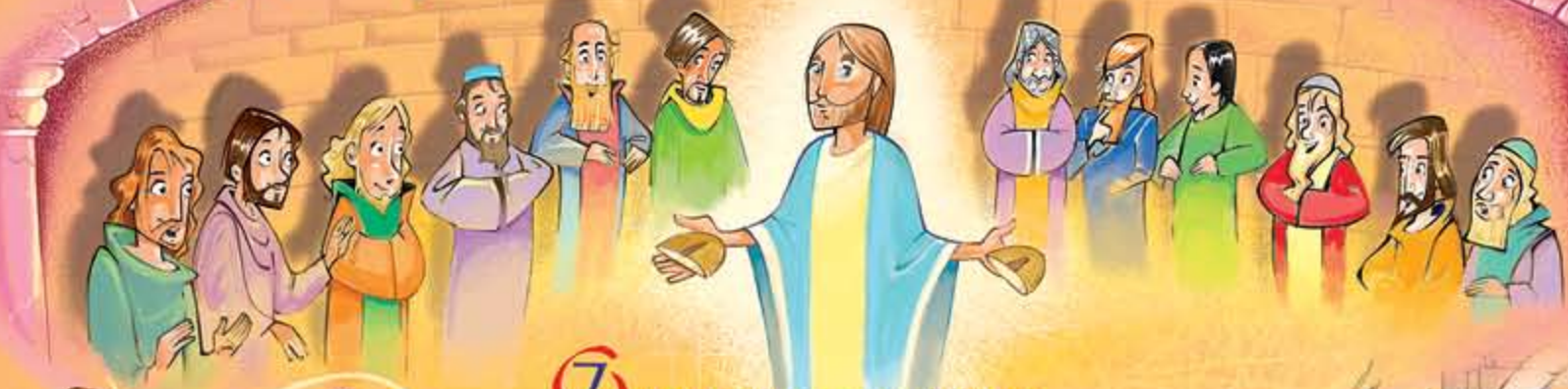
7 NEL CENACOLO DELL'AMORE Matteo 26,20-26-29